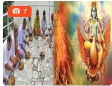
Jaipur News तेरहवीं में खाना खाने वाले दे द्यान, जान लें क्या है गरुड़ पुराण में इसका अंजाम