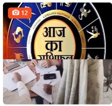
Banswara news बांसवाड़ा में परीक्षा का मजाक, वीक्षकों ने हल किए पर्चे, ग्रामीणों को बेंच पर बिठाकर खिंचवा दिए फोटोज