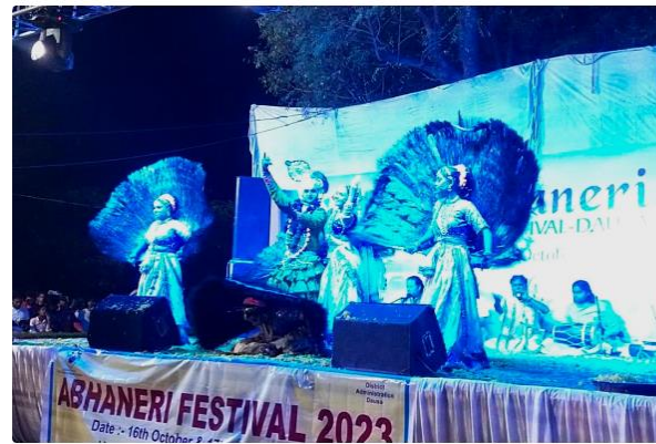
आभानेरी फेस्टिवल पर लोक संस्कृति की दिखी छटा

दौसा: दौसा जिले के बांदीकुई में राजस्थान पर्यटन विभाग और जिला प्रशासन की ओर से आठवीं सदी में निर्मित विश्व प्रसिद्ध आभानेरी की चांद बावड़ी पर दो दिवसीय आभानेरी फेस्टिवल का समापन मंगलवार को हो गया. इस दौरान चांद बावड़ी की फूलों व रंगीन लाइटिंग से आकर्षक सजावट की गई.